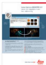
Leica Cyclone REGISTER