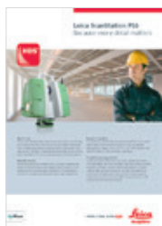
Leica ScanStation P16

Abbildungen, Beschreibungen und technische Daten sind nicht verbindlich. Änderungen vorbehalten. Gedruckt in der Schweiz – Copyright Leica Geosystems AG, Heerbrugg, Schweiz, 2015. 832254de – 03.15 – INT